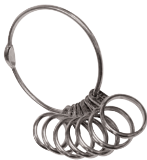
MISURATORE DI ANELLI | COD. 941 | 11,00€ Metallo, 7 dimensioni

La confezione non è la cosa più importante, ma un gioiello è sempre un regalo, anche se lo compriamo per noi. È per questo che riceverai tutti gli articoli Vegas in una confezione incantevole e raffinata. Oltre a rendere ancora più belli i tuoi gioielli, li protegge.