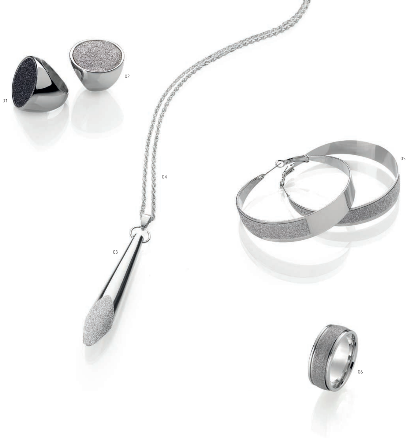
01 | ANELLO | COD. 2296 | 67,90€ Acciaio inox, (Ø 28mm), lucido, diamantato antracite, dim.: 50-62